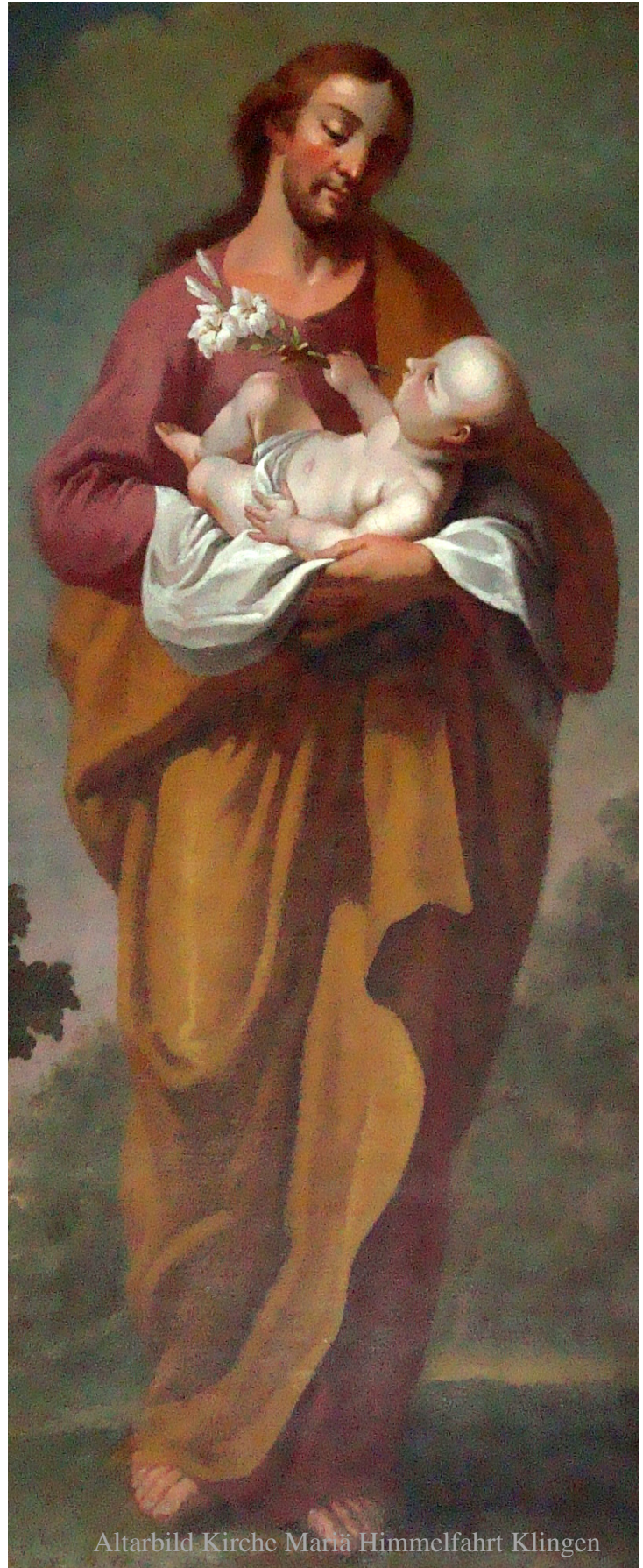
Altarbild Kirche Mariä Himmelfahrt Klingen

Im Anschluss an den Gottesdienst werden wir den Abend gemütlich im Pfarrheim ausklingen lassen.